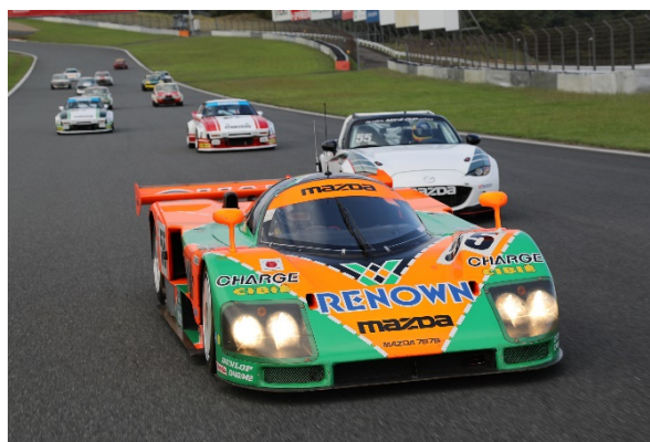
La Mazda 787B défilant aux côtés de plusieurs modèles historiques de la marque (2018, « Dans la peau d'un pilote » sur le circuit FUJI SPEEDWAY)

Mazda continuera de cultiver le plaisir de conduire et d'être animé par un esprit de défi permanent, avec l'ambition de proposer des expériences à même de transmettre ces valeurs aux générations futures.